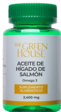
HIGADO DE SALMON