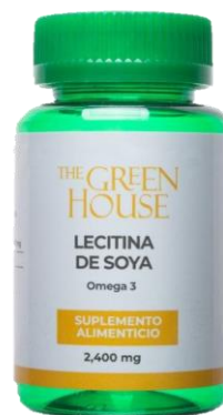
LECTINA DE SOYA