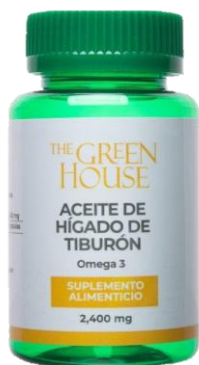
HIGADO DE TIBURON

UNA ALIMENTACION SALUDABLE NO SOLO BRINDA BENEFICIOS ESTETICOS, SINO QUE REDUCE EL RIESGO DE SUFRIR ENFERMEDADES